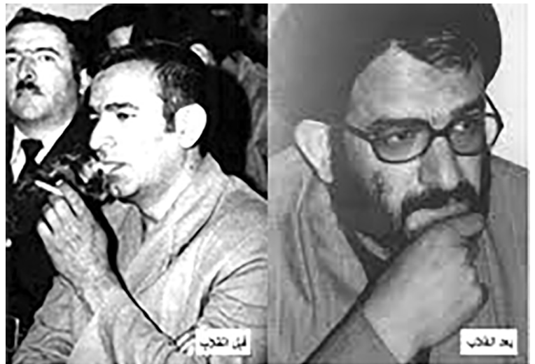
سالها قبل، «سیدمهدوی هاشمی» معاون واحد تعلیمات در «کانون جوانان» به جرم قتل به زندان رفت و «حزبانان کوربانی» هم از او بهشت شد. هاشمی برای دادگاه ثبت احوال منتظر بود و قتل انقلاب به اتهام دست داشتن در قتل آیت الله خمینی (کتاب استیغاب) شده بود. اما رسیدن به پرونده او به انقلاب حوزیه و آزاد شد اما دوباره در سال ۶۳۴ دستگیر شده و از پاره هم پرونده قتلش به جریان افتاد و ده به دستور قتل «امیر محمدان» مرتضی‌ان، «شیخ‌مسیر غنی» قتل‌زاده، «مجتبی حسینی» و «محمد مهدوی روشی» کشتی و «انجاء» جاده ایمنی علیه نظام ملهم شد. در نهایت ده‌ها که او را به اعدام محاکم کرد.

من فکر می‌کنم مشخصاً مرحوم احمد آقا خمینی بود. گزارش‌هایی تنظیم می‌کرد تا اختلاف بیفتد و بتواند قائم مقام رهبر شود. در آن زمان معروف بود اینکه برخی به